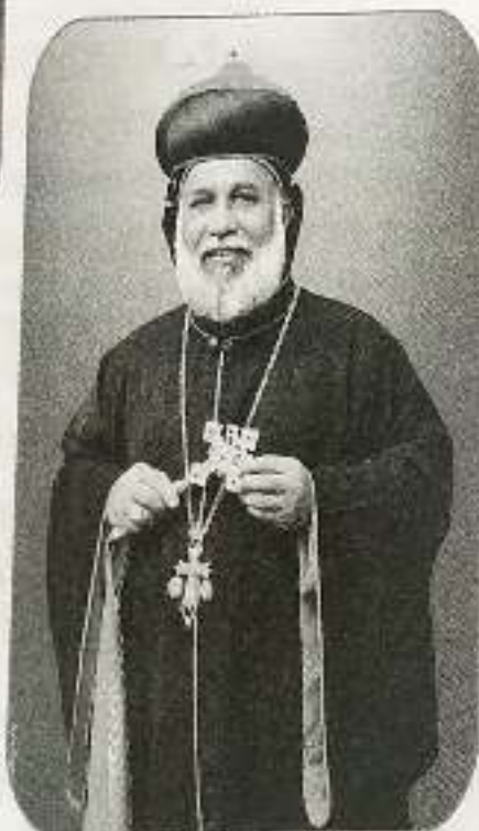
Patron Major Archbishop Basellos Cardinal Cleemis Catholicos