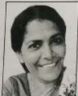
Dr. Theresa Susan A. Sresthacharya Award