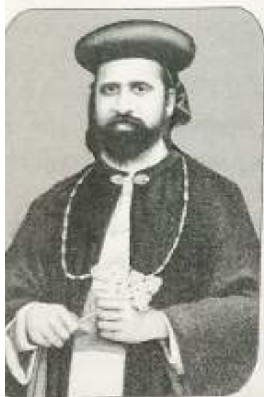
Heavenly Patron shop Jacob Mar Theophilus