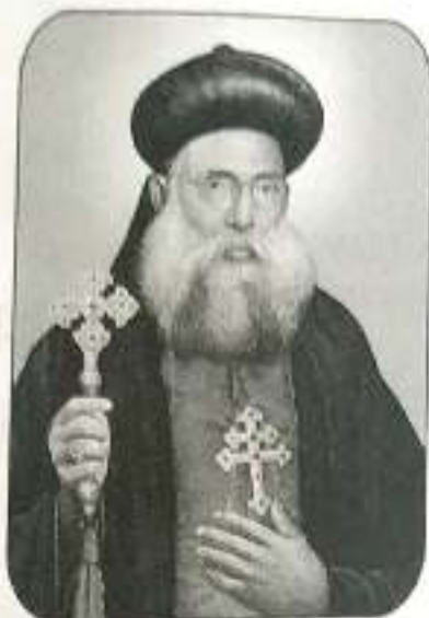
Servant of God Archbishop Geevarghese Mar Ivanios